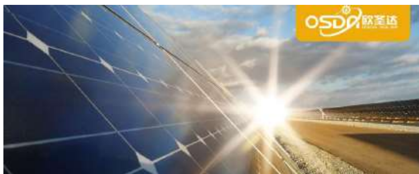
Рисунок 3. Панели фотоэлемента

поликристаллический кремний был первым, кто начал использоваться в производстве фотоэлементов. На сегодняшний день гетероструктурные фотоэлектрические системы меню настроек подготовлены ящиками по всему миру, построены обучающие системы и на 80 процентов зарубежные. Их КПД составляет 16÷18% . В последние годы гетероструктурные фотоэлементы системы настройки, аморфный кремний, кадмий - теллур получены в виде тонких пленок. Их КПД составляет около 9 %, но они дешевле в производстве, чем фотоэлектрические элементы из моно- или поликристаллического кремния.